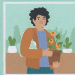
۱۵ مدیر خزانه‌ی گیاهان