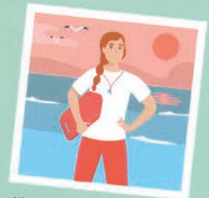
۳۴ نجات غریق