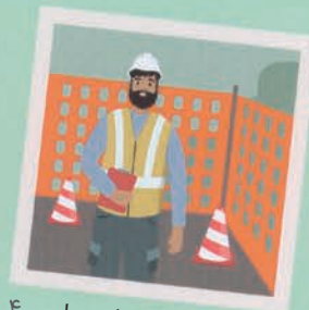
۴۰ مهندس راه و ساختمان