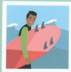
۳۵ مربی موج سواری