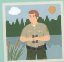
۱۶ مأمور محیط‌زیست