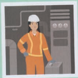
۳۸ مهندس کشتی رانی