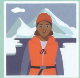
۸ زیست‌شناس دریایی