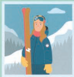
۲۴ مربی اسکی