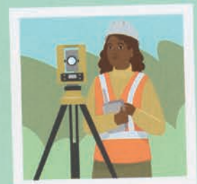
۴۴ نقشه بردار