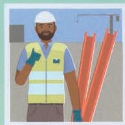
۲۲ مدیر ساخت‌وساز