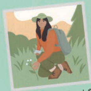
۴۲ گیاه شناس