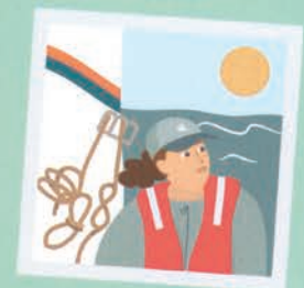
۳۹ مربی قایق رانی