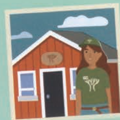
۲۰ مدیر اردوگاه