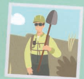
۱۹ آتش‌نشان محیط‌زیست