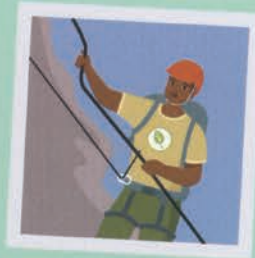
راهنمای تورهای ماجرایوانه ۲۸