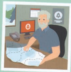
هماهنگ کننده جست و جو و نجات ۳۶