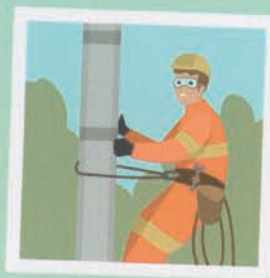
۴۵ تکنسین برق